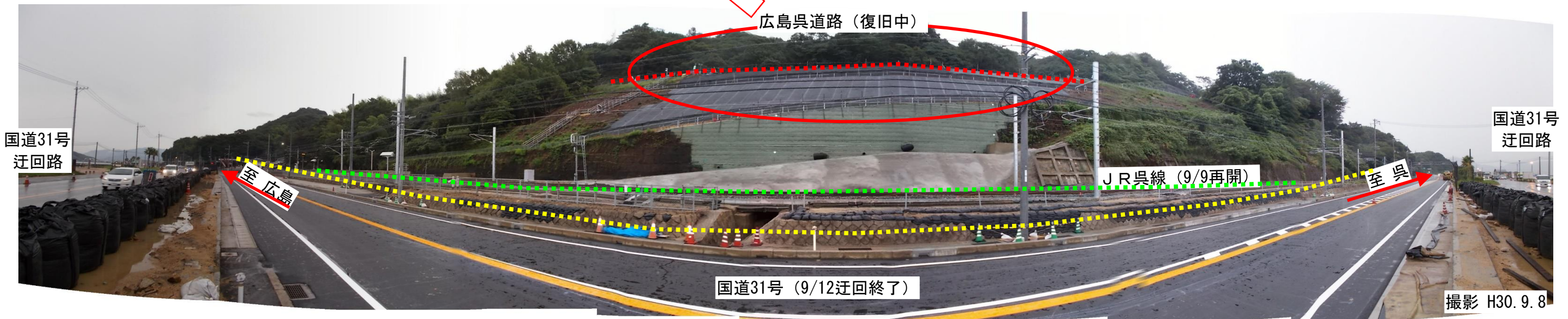
撮影 H30. 9. 8

広島呉道路（クリアライン）の山側から土石流が発生し、道路本体を損壊、JR呉線用地及び国道31号を超え、坂町水尻のベイサイドビーチ坂に達しました。早期の通行再開のため、NEXCO西日本は学識経験者による復旧検討委員会を立ち上げ、重篤な被災箇所として復旧に関する検討を行われ、24時間体制で復旧を行い、9月27日15時に復旧する見込となりました。