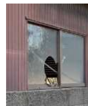
窓が割れた 管理不全空家