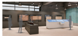
Exhibit of drawings of naval vessels