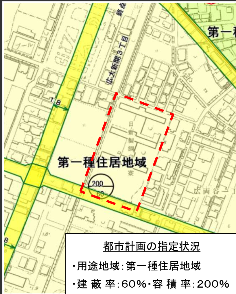
変更前（第一種住居地域）