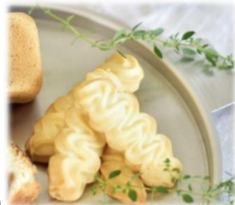
これはイメージです