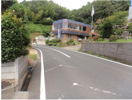
26-36: 交通が多く見通しが悪いため危険