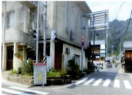
26-38: 道幅が狭く歩道が無いため危険