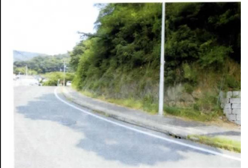
26-39: 歩道が狭くガードレールが無いため危険