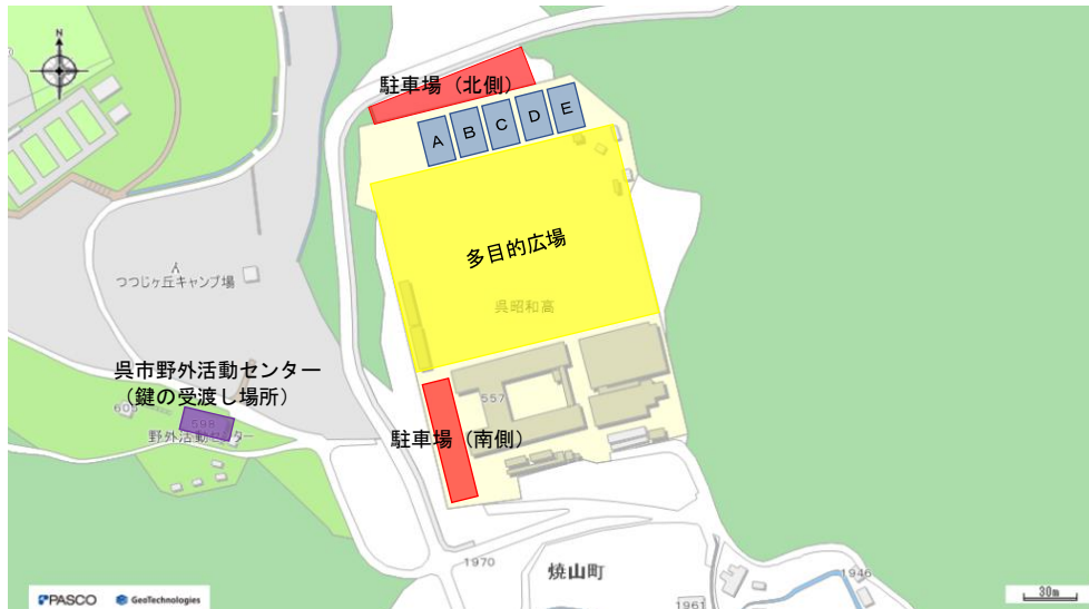
【呉地理情報マップ】