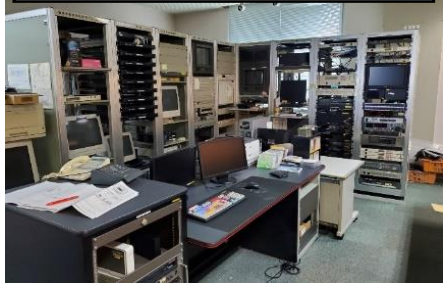
撤去する主な伝送路設備類