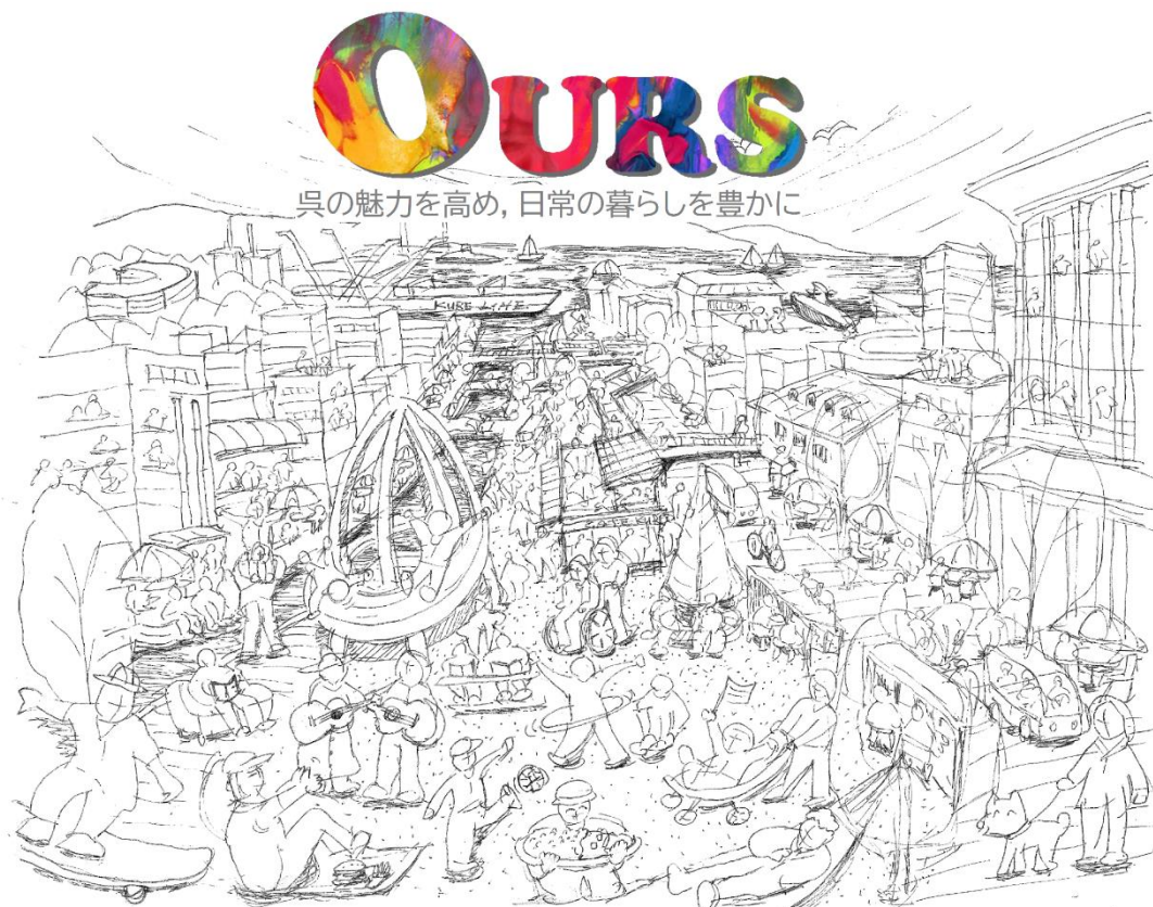
※未来の姿を示すイラストを作成中です