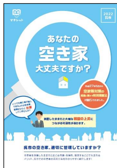
活用紹介リーフレット