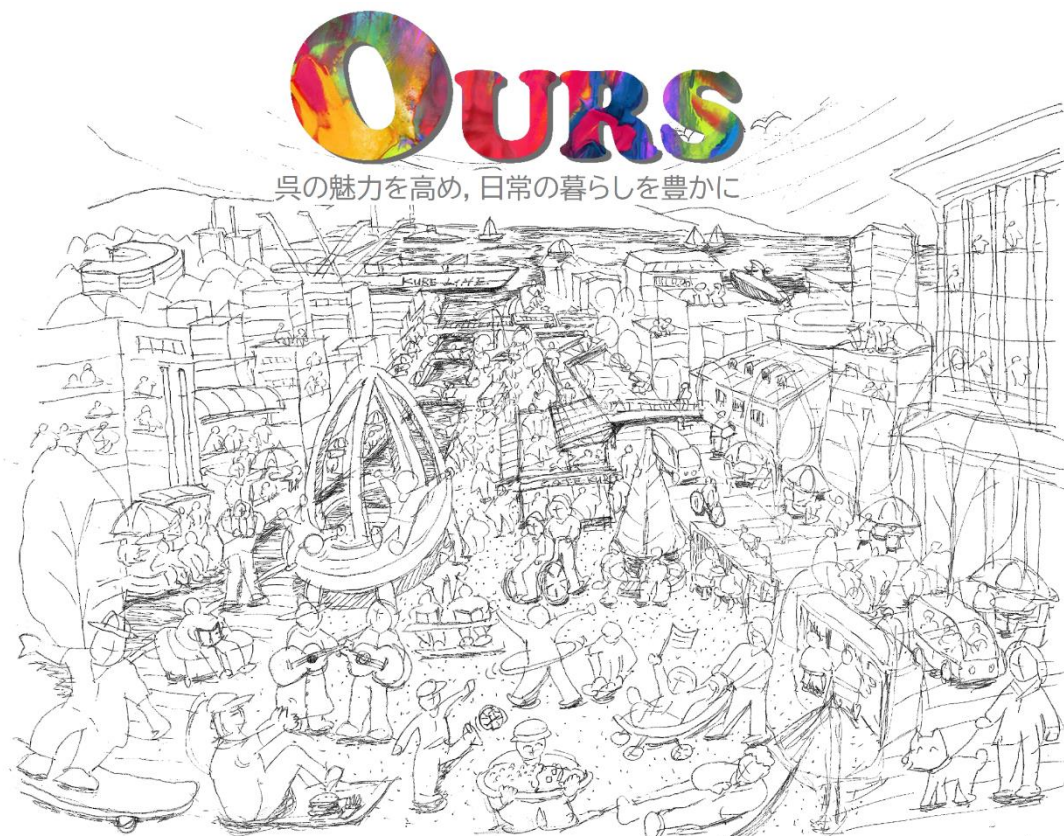
※未来の姿を示すイラストを作成中です