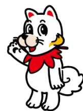
広島広域都市圏マスコットキャラクター ひろしま都市犬はっしー