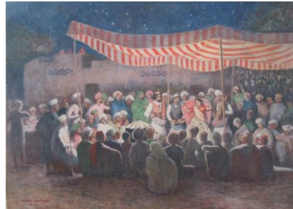
《婚礼の夜の催し》1916年