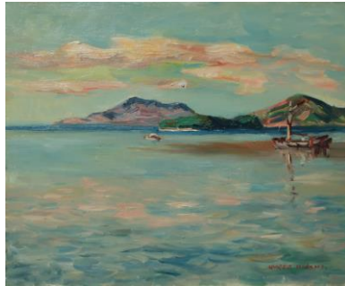
《遠浅の海》制作年不詳