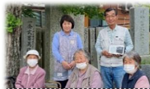
調査に協力いただいた皆さん

先月は「かみかまラジオ」のラジオスポットを探すため、島内のあちこちで無線を飛ばしていました！頑張って準備した機材や音源を皆さんに届けられそうなので、ほっと一安心しています。