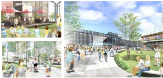
(呉駅周辺地域総合開発基本計画から抜粋)