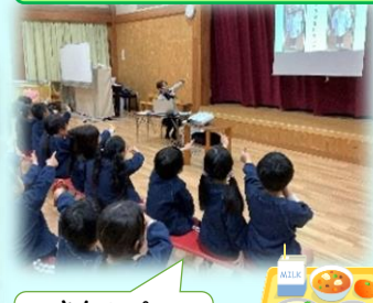
きなこパン おいしそう!