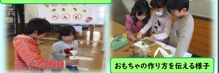
おもちゃの作り方を伝える様子