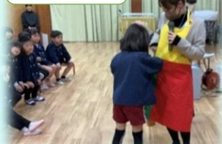
食材の栄養素クイズ