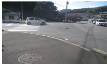
(要望案) 信号機の設置

R4-5: 丁字路で右折車, 左折車がスピードを緩めることなく横断歩道に進入し, 危険である。