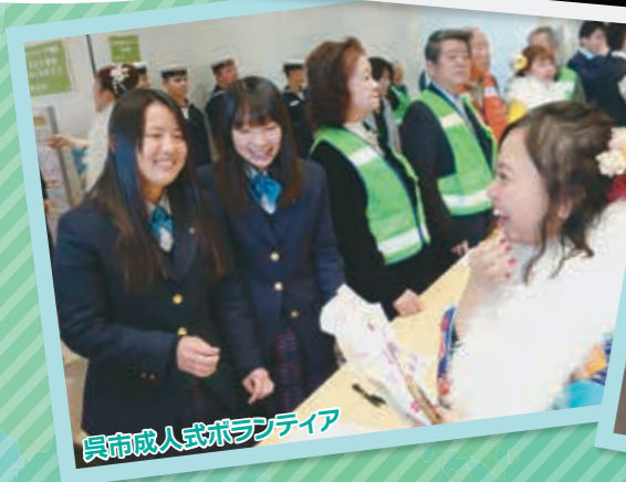
呉市成人式ボランティア