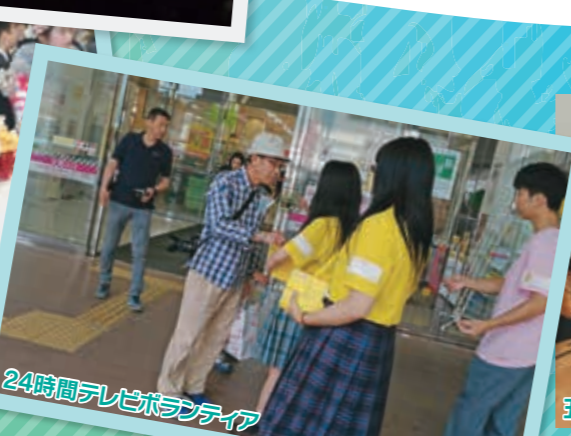
24時間テレビボランティア