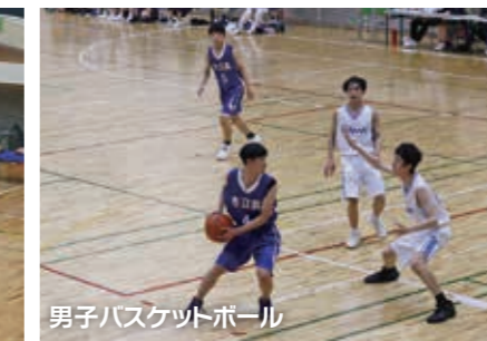
男子バスケットボール