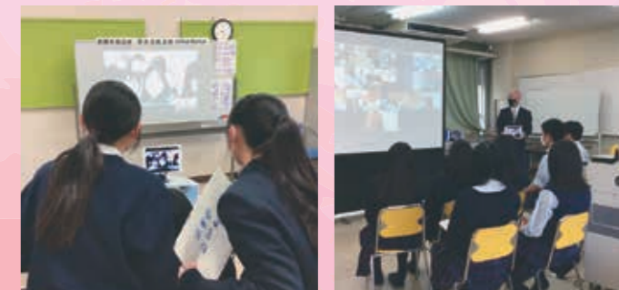
昌原市アダム高校とのオンライン交流会 オリンピック高校とのオンライン交流会

呉市と姉妹都市提携を結んだ台湾の基隆市立安樂高級中學との交流のほか、様々な国際交流を行っています。