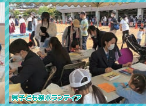
呉子ども祭ボランティア