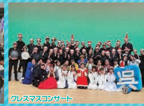
クリスマスコンサート