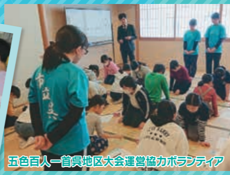
五色百人一首呉地区大会運営協力ボランティア