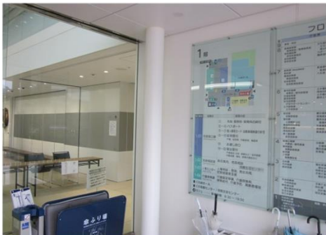
1F 西エントランス風除室 案内板