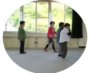
健康的に美しく歩くコツを学びました。