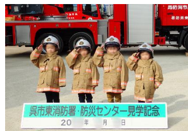
防火衣の装着体験