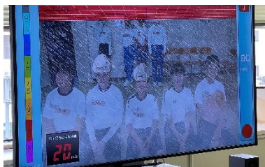
豪雨暴風疑似体験