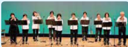
Noro de オカリナ