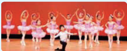
川尻クラシックバレエ