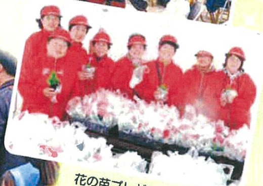
花の苗プレゼント(交通安全母の会) できたよ シャボン玉