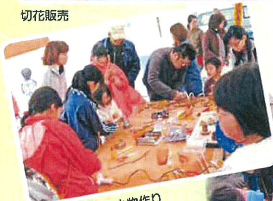
木工教室 小物作り