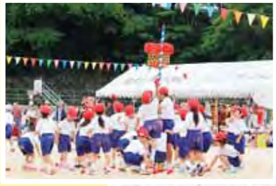
1年生 ボンボン 玉入れ