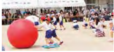
2年生 大玉ころがし