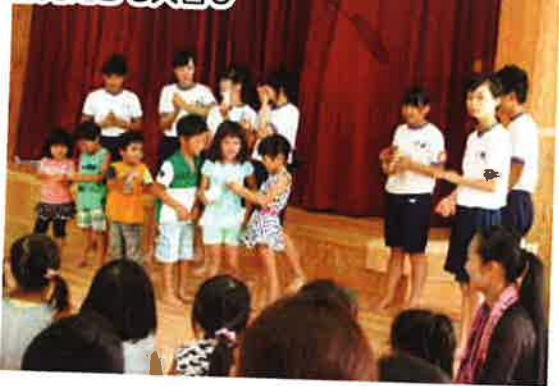
園児たちも大喜び