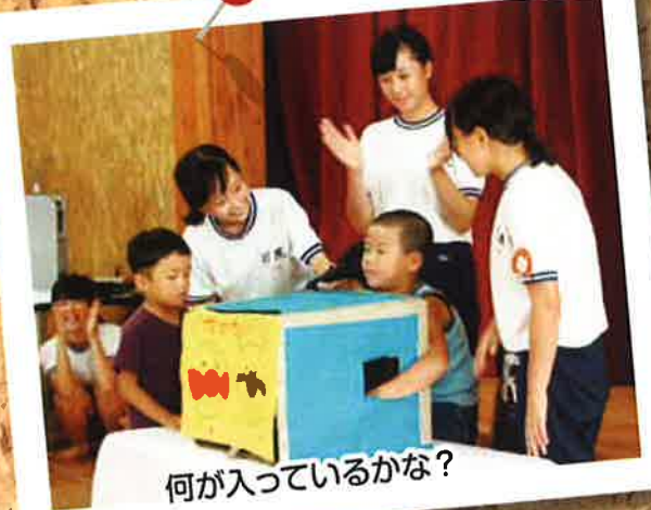
何が入っているかな?