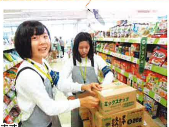
ゆめマート川尻店で