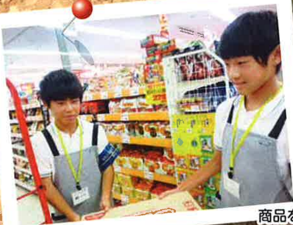
商品を並べています

8月20日から26日まで「呉市 キャリア・スタート・ウィーク」 が22の事業所で行われ、中学2年 生がそれぞれの職場や団体で貴重 な体験をしました。