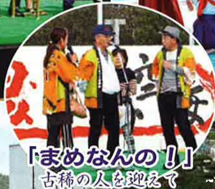
「まめなんの！」 古稀の人を迎えて