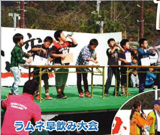
ラムネ早飲み大会