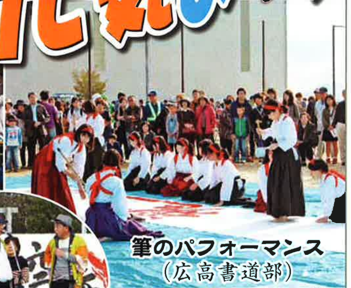
筆のパフォーマンス (広高書道部)