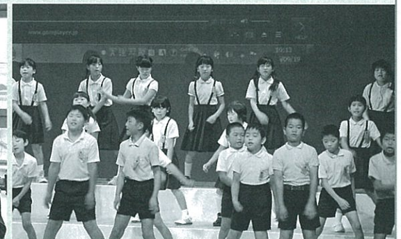
川尻小4年生の合唱