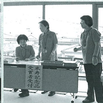
民生委員も受けのお手伝い