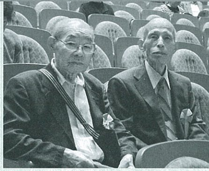
米寿おめでとうございます