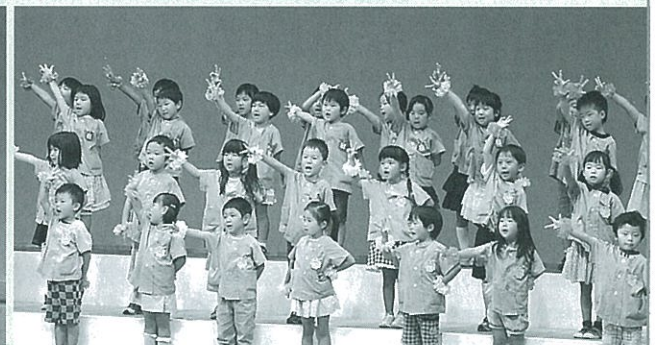
川尻光幼稚園の手話をとり入れた合唱