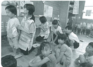
↑光幼稚園 身体測定を一緒にしました

8月22日(月)～8 月26日(金)まで、呉市 キャリア・スタート・ ウィークが行われ、 中学2年生が町内外 の事業所で職場体験 をしました。