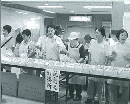
記念品を渡すボランティアさざなみ