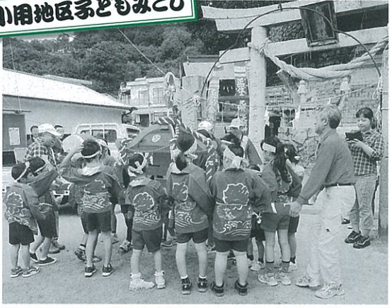
小用地区子どもみこし