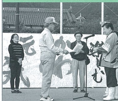
◀川尻農産物 表彰式