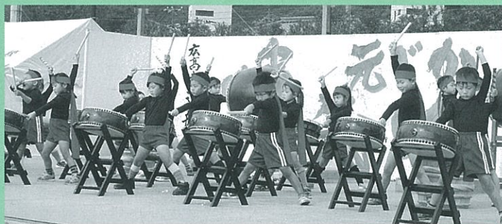
▲かがやけこども千本桜(川尻保育所)