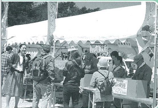
野呂の市も大盛況