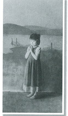
大畑稔浩【祈り】油彩 162cm×91cm