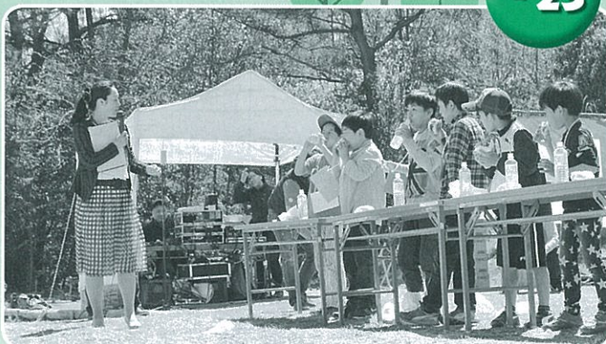
野呂山バーガー朝食大会