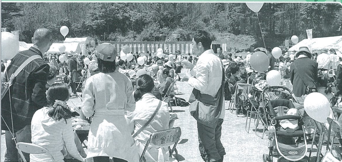
大勢の人が野呂山頂に集まりました