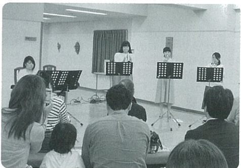
野呂山レストハウス

野呂山レストハウスで呉にゆかりのあるモノ作り作家による作品展示とトランプベットのトリオ松娘のコンサート、野呂山ピジターセンターでは出品作家によるワークショップが開催されました。