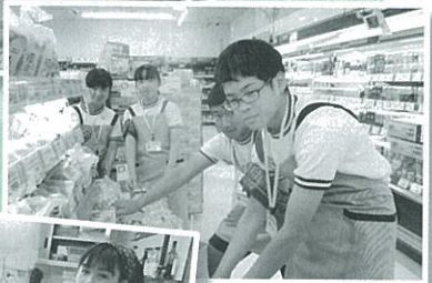
ゆめマート川尻店