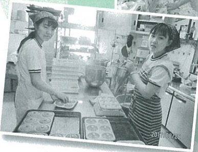
アラビアンナイト