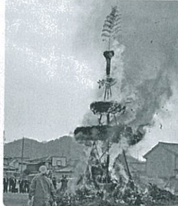
燃え上がるとんど