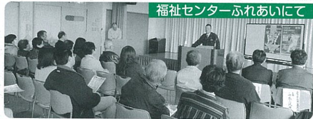
福祉センターふれあいにて

地域住民が集まり、呉市社会福祉協議会職員による「これからの地域福祉」についての講演と川尻駐在所森警部補から特殊詐欺や高齢者の事故防止、110番の利用法についての話がありました。