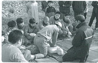
とんどの前に防災訓練があり、皆でAEDの心肺蘇生法を習いました。