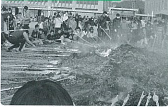
お餅を焼く子どもたち