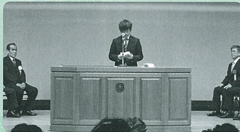
「私たちの誓い」を宣言