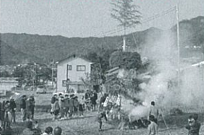
中学生ボランティアが点火