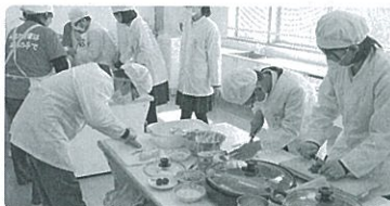
一日の始まりは朝食から

川尻小学校で6年生を対象にした、食生活改善推進員による「簡単にできる食事作り」の料理教室がありました。