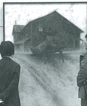
左:第41回日展特選「瀬戸」 右:第43回日展特選「浜」