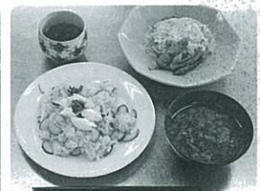
(献立)・彩りちらし・ひじきと野菜のつね卵あかけ・とろろ昆布汁

川尻町の人口と世帯数 人口/8,464人(男性4,140人・女性4,324人) 世帯数/3,913世帯 (2月末現在) 前月比/21人減 前年比/107人減