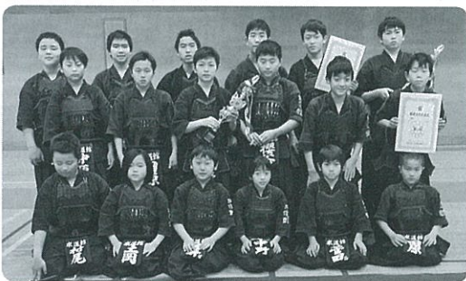
呉市スポーツ少年団交歓剣道大会 〈団体戦〉 ●高学年の部：優勝 ●中学生の部：第2位