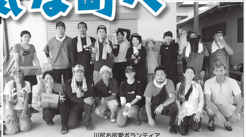
川尻お尻愛ボランティア