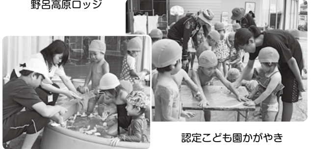
認定こども園かがやき