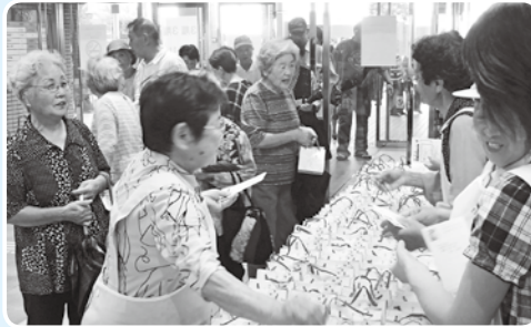
▲ボランティアさざなみが記念品を配布 この他にも大勢のボランティアの支えがありました