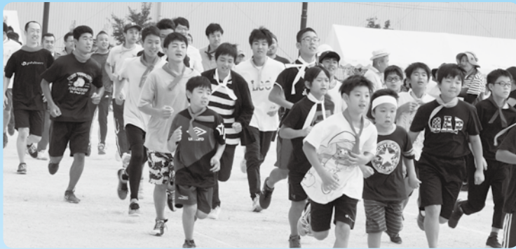
ふれあい男子リレー前のウォーミングアップ

自治会や女性会、園児、小中高生も加わり、町民体育祭が川尻グラウンドでありました。西部と東部に分かれ、競いました。西部地区に軍配が上がりましたが、全員が気持ちの良い汗を流しました。