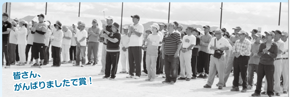
皆さん、がんばりましたで賞!