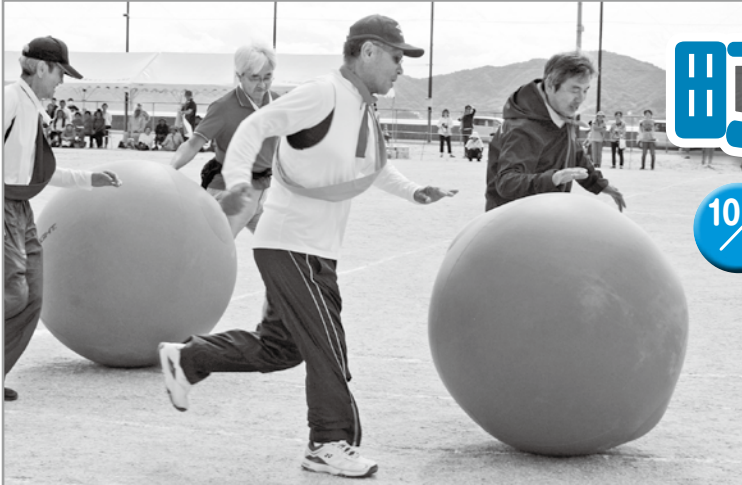
大玉ころがし ポールを投げてはいけません