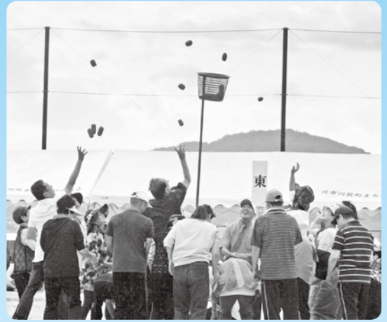
自治会の玉入れ 大人たちも楽しそうですね