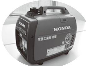
寄贈された発電機