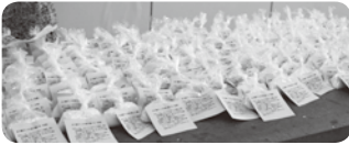
約250人分 出来上がり ました

24年間続いている当講習会が今年もありました。新型コロナウイルス感染拡大の影響で、理事だけで作り、会員や町内の各施設に配られました。