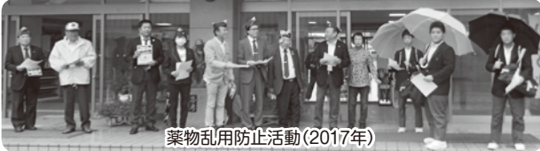
薬物乱用防止活動(2017年)

沢山の方のご支援を頂き活動してまいりましたが、少人数でのライオンズ活動は不可能となり、この度解散する事となりました。47年の長きにわたり活動出来たことを喜びに代え皆様に感謝申し上げます。