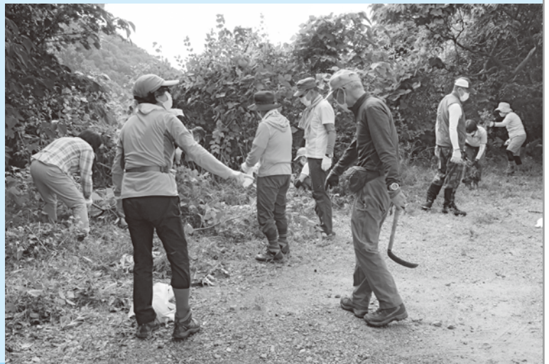
▲登山者駐車場の草刈り