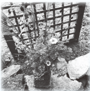
入り口を飾る 秋の寄せ植え