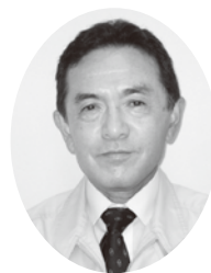
川尻市民センター センター長