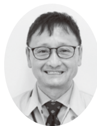
川尻市民センター 副センター長

地元川尻での勤務は初めてですが、職員みんなと力を併せて、より良いサービスが提供できるように努めてまいりますので、どうぞよろしくお願いいたします。