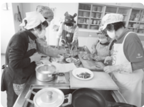
塩分控えめ、カルシウムたっぷり