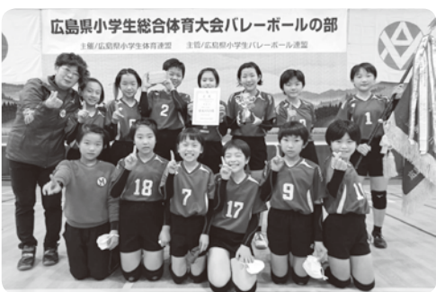
広島県小学生総合体育大会バレーボールの部 主催/広島県小学生体育連盟 主協/広島県小学生バレーボール連盟