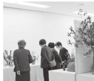
まちづくりセンター