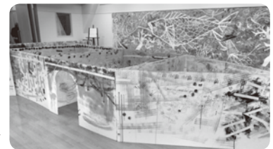
写真:野呂山レストハウスにて