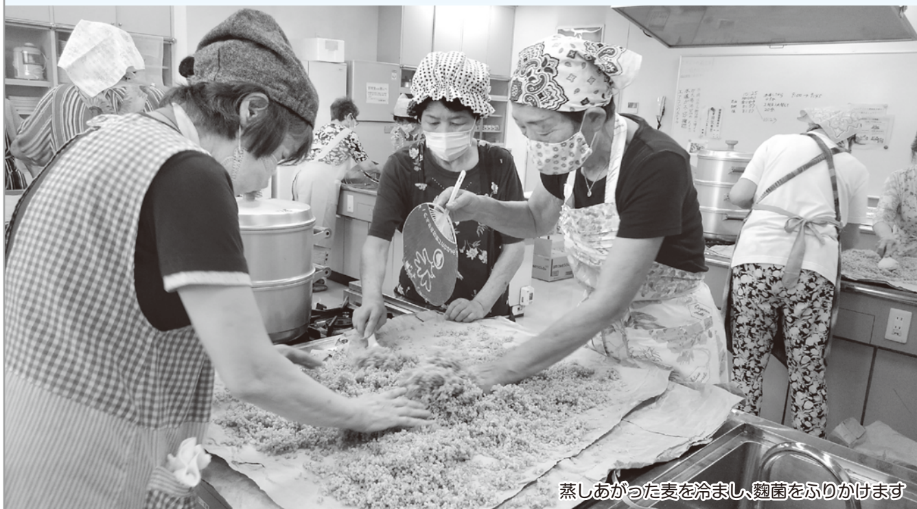
蒸しあがった麦を冷まし、麴菌をふりかけます