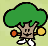
ひろしまの森づくりキャラクター モーリー

呉市では、皆様からいただいた「ひろしまの森づくり県民税」を財源として、景観保全、防災・減災、鳥獣被害防止等のための里山林整備や、住民団体による森林整備活動の支援等を行っています。