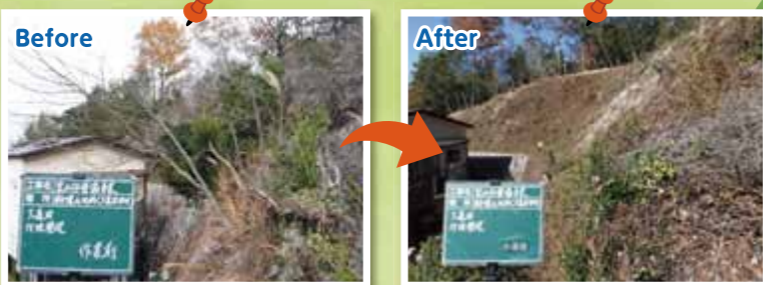
民家周辺の危険木を伐採

令和3年度には、市内の計3.71haの森林整備や、森林ボランティア2団体の活動支援、森林整備についての講習会を実施しました。