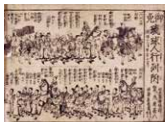
▲「御免琉球人行列附」 天保13(1842)年