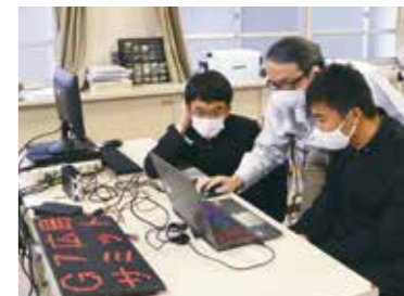
▲カウントダウンボードを製作する、呉工業高等学校の生徒と先生

デザインやものづくりを学ぶ、県内7つの高校の生徒がG7広島サミットのカウントダウンボードを製作しました。そのうちの1つは、呉工業高等学校の生徒がそれぞれの得意分野を生かし、力を合わせて作り上げたもので、大和ミュージアムのエントランスに設置されます。サミットまでのカウントダウンを一緒に、オール広島で一緒に盛り上げていきませんか♪