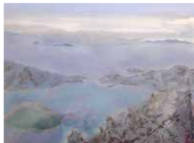
▲木本雅典《島波(野呂山より)》2022年

料金 無料 【関連イベント】 作家によるギャラリートーク 日時 3/12(日)13:00～ 場所 2階第1展示室