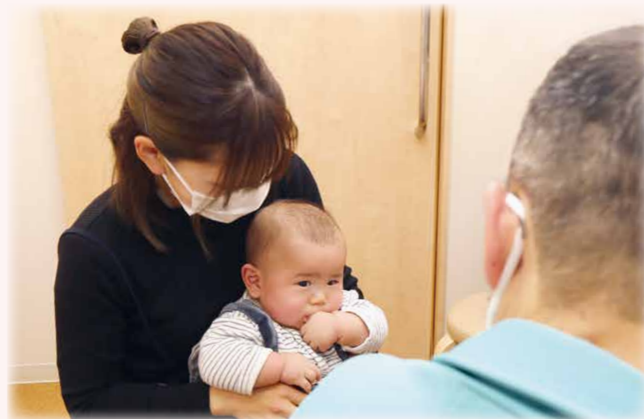
▲「3～4か月児健康診査」の様子

実際に乳幼児健康診査を行っている現場で、子どもたちを見守る小児科の先生や、受診した保護者に思いを聞きました。