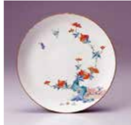
▲「色絵柘榴柴垣鳥文皿」 1670-90年