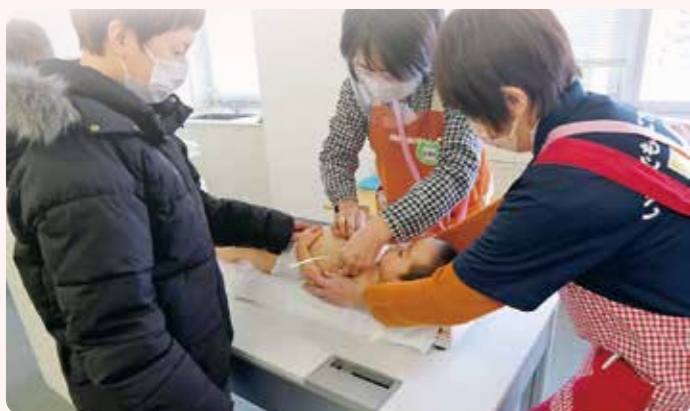
身体測定・・・身長・体重などを計測