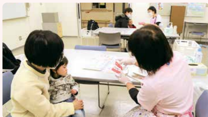
歯科相談・・・歯科衛生士による歯や口に関する相談