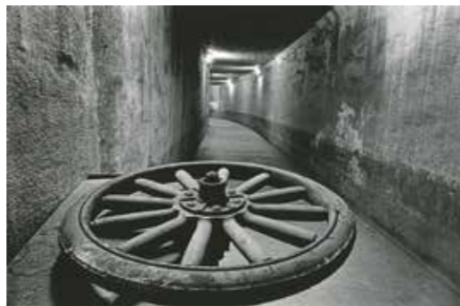
▲奈良原一高「人間の土地」より《緑なき島-軍艦島:地下道(トンネル)》1954-57年

期間 3/26(日)まで10:00～17:00(入館は16:30まで。火曜日休館。[祝日の場合は翌日])