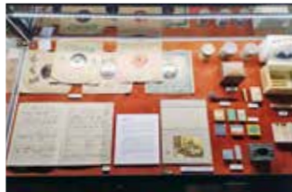
▲南薫造の遺品《レコード、楽譜、葉巻など》