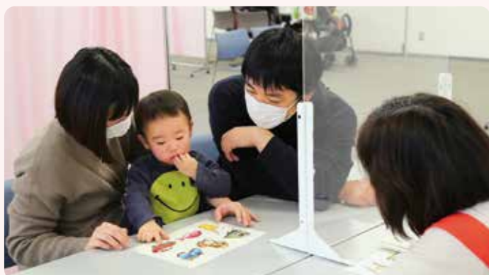
個別相談・・・保健師や栄養士、心理職などによる育児の相談