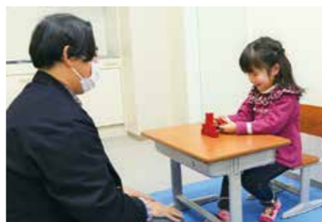
▲5歳児発達相談の様子(イメージ写真)

特に5歳児は、社会性が身に付き始め、抱える問題が表面化しやすい時期です。このタイミングで発達相談を行うことは、特徴の早期理解につながり、不安を少しでも解消して小学校に入学できるため、とても効果的です。