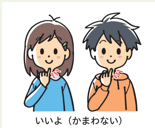
いいよ (かまわない)