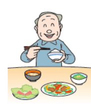
十分な休養とバランスのとれた栄養