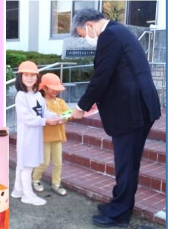
改善センター訪問

「いつもありがとう」と可愛い児童の訪問に、心がほっこりした朝となりました。子どもは地域の宝！みんなで見守っていきましょう。