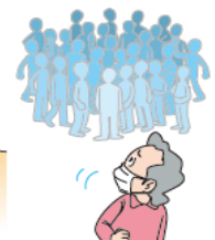
無用に人混みに入らない