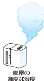
部屋の適度な湿度