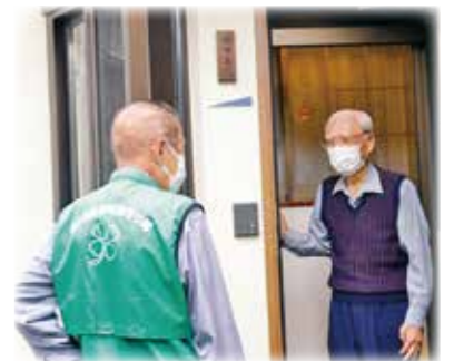
見守り活動を行う第二地区地域見守り隊

見守り活動の中で、会話が合わない高齢者や、物忘れが急にひどくなり、一人暮らしが心配になる人がいることが分かりました。そんな時、認知症について学ぶ機会があり、それは認知症の症状の一つであることや、私たちの見守り活動が、認知症の人やその家族の大きな助けになることを知りました。実際に、認知症の知識を得て見守り活動してみると、認知症があっても落ち着いた対応ができ、また、これまでどこか他人事だった認知症のことを、誰でも歳を取れば起こりうることなんだと、自分事に捉えられるようになりました。認知症への理解が他の地域でももっと深まり、より「安心して暮らせるまち・呉市」になってくれればいいと思います。