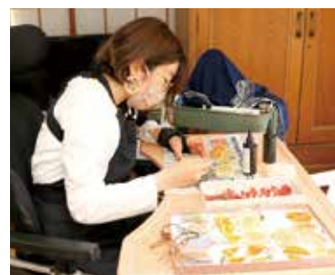
▲レジンを使ったアクセサリーづくり。1つ1つ手作業で丁寧に仕上げる。

35歳。昭和地区在住。アクセサリー作家・OriHimeパイロット。「できるうちにやりたいことを」をモットーに昨年アクセサリー作家デビュー。今春からは、病気などの理由で外出が困難な人が、ロボットを遠隔操作し、接客スタッフとして働く「OriHimeパイロット」として活躍の場を広げる。現在は、障害者就労支援の一環で企業と障害者をリモートワークでつなぐ活動にも力を入れている。