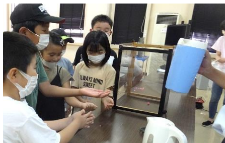
ヒヤッ！とする実験：8/10火