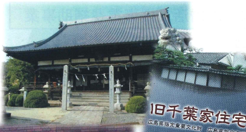
旧千葉家住宅 広島県指定重要文化財 広島県指定名勝