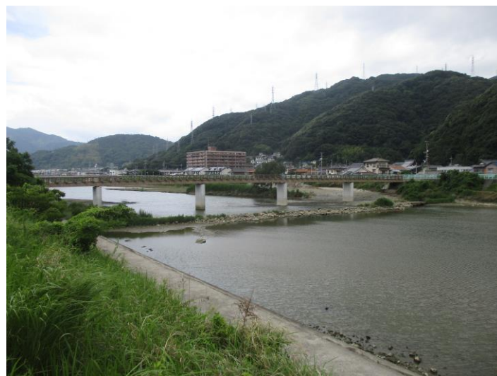
【写真】復旧工事が完了した真光寺橋