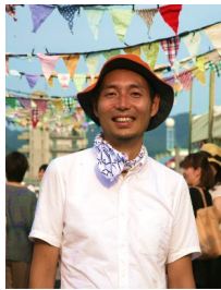
都市計画家 株式会社サルトコラポレイティブ 代表