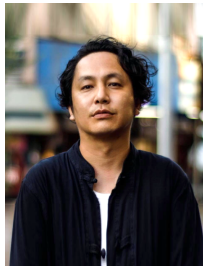
NPO法人SYL理事長 / 株式会社ローカズオンリー 代表取締役 呉市長期総合計画 審議員 / 呉市観光振興計画 審議員 / 第2回リノベーションスクール@呉 ユニットマスター